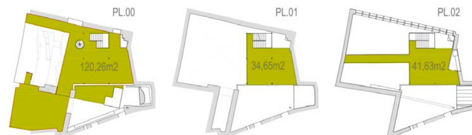
SUPERFICIES ÚTILES POR PLANTA